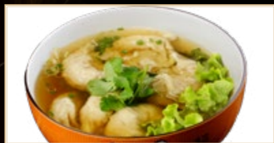
59 6.00€ Potage Raviolis Chinois