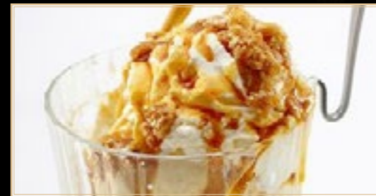
A10 5.00€ Coupe Brésilienne Glace Café