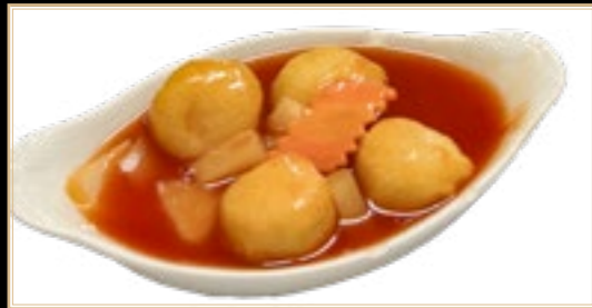
105 13.00€ Beignets de Poulet à la Sauce Aigre-douce