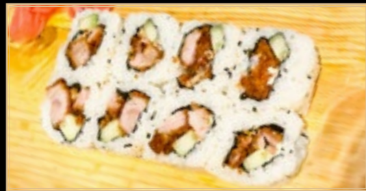
32 10.00€ Uramaki Poulet Poulet et Concombre