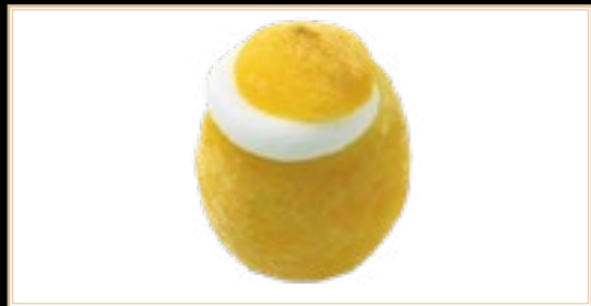
A5 6.00€ Citron Givrée Supplémentaire +3.00€