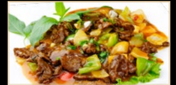
112 14.00€ Boeuf à la Sauce Piquant