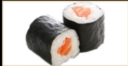
15 6.00€ Sake Maki Saumon