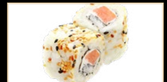
30 10.00€ Philadelphia Saumon Fromage