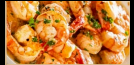
98 16.00€ Scampis Beurre À L'ail