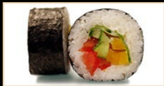
38 10.00€ Yasai Légumes