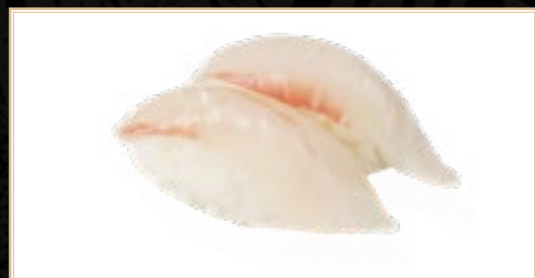
4 Suzuki Bar 4.00€