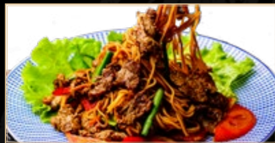
84 12.50€ Nouilles Sautées au Boeuf