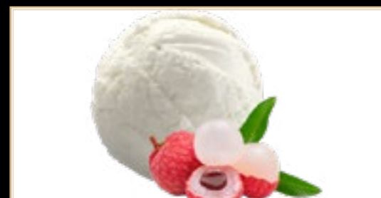
A14 5.00€ Glace Lychee