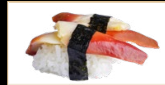
8 Sushi Palourdes 5.00€