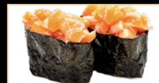
12 Sake Épicé Saumon Épicé 5.00€