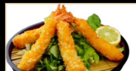
64 6.00€ Crevettes Panées