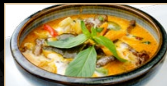
110 14.00€ Boeuf à la Sauce Curry