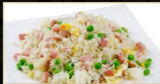
82 12.50€ Riz Sauté Cantonais