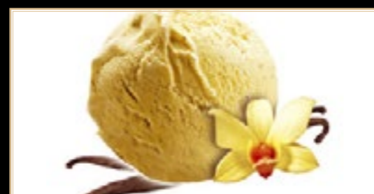
A17 4.50€ Glace Vanille