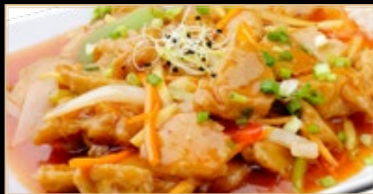
107 13.00€ Poulet à la Sauce Piquant