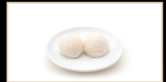
A22 5.00€ Perle de coco