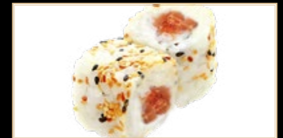
28 10.00€ Spicy Sake Saumon Avocat Épicé