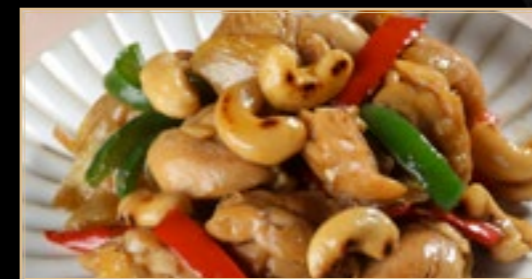
103 14.50€ Poulet Aux Noix De Cajou