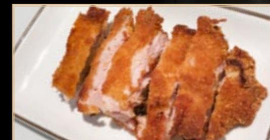
76 6.50€ Poulet Croustillant