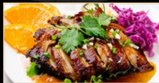
118 16.00€ Canard à l'Orange