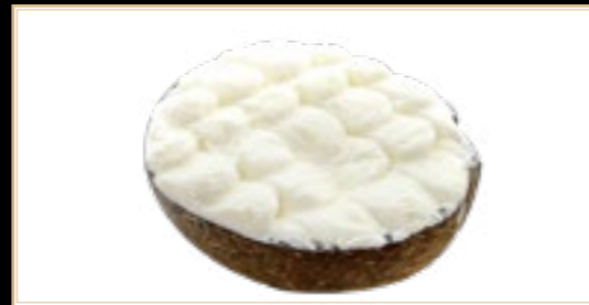
A6 6.00€ Coco Givrée Supplémentaire +3.00€