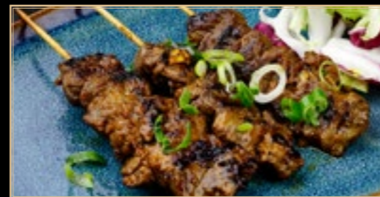
69 6.50€ Saté De Porc