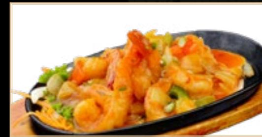
101 17.00€ Ti-pan Aux Scampis Piquantes