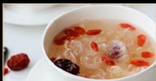
57 5.00€ Potage Nids D'hirondelles