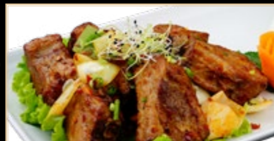
120 16.00€ Spare-ribs Aux Cinq Parfums