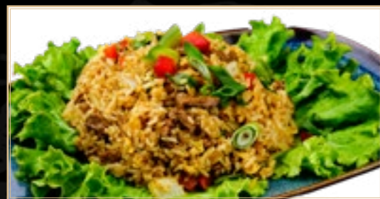
80 12.50€ Riz Sauté au Boeuf