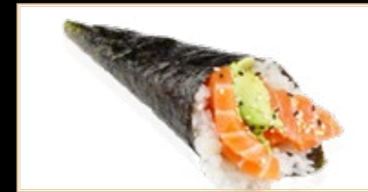
39 5.00€ Sake Saumon avocat