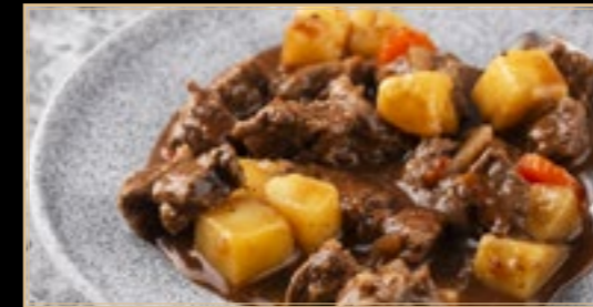
111 14.00€ Boeuf aux Ananas