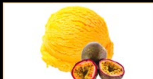
A18 5.00€ Sorbet Passion