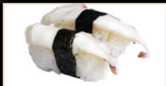
7 Tako Poulpe 4.00€