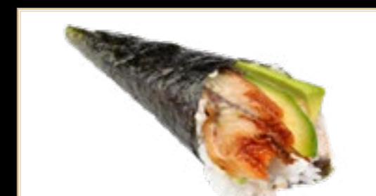
43 5.00€ Unaghi Anguille