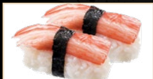
6 Crabe 4.00€