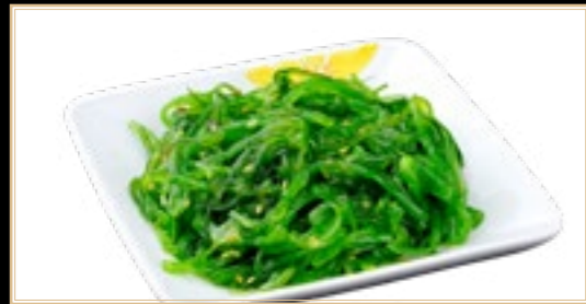
45 5.00€ Laitue Salade d'algues