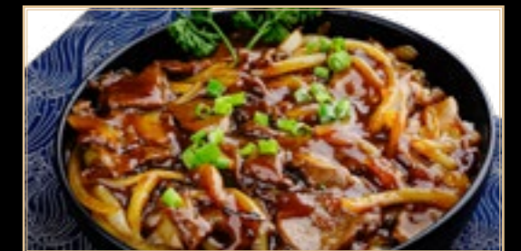
114 14.00€ Boeuf aux Champignons Chinois