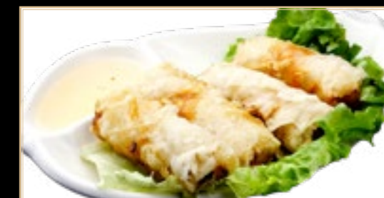
61 6.00€ Croquettes Vietnamiennes