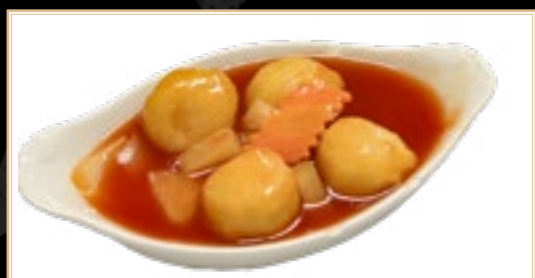
119 13.00€ Beignets de Porc à la Sauce Aigre-douce