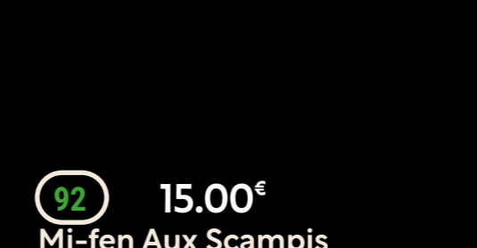
92 15.00€ Mi-fen Aux Scampis