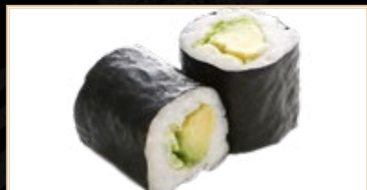
21 6.00€ Maki avocat