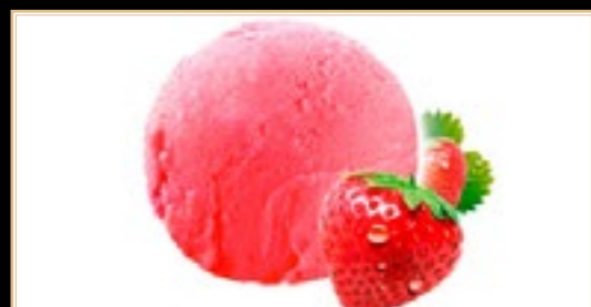
A13 4.50€ Glace Fraise