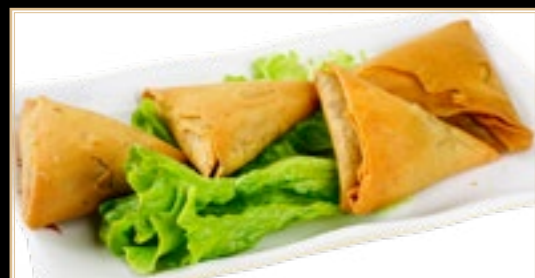
70 6.00€ Triangles curry