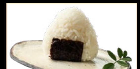
44 5.00€ Onigiri Saumon Cuit