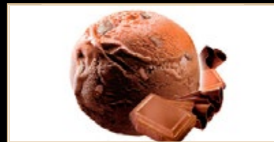
A12 4.50€ Glace Chocolade