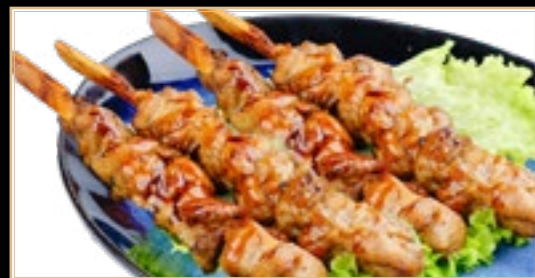
68 6.50€ Saté De Poulet