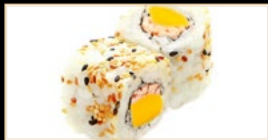
33 10.00€ Sake Mango Saumon cuit et Mangue