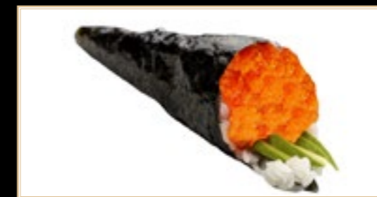
41 5.00€ Galifornia Crabe Oeufs De Poisson