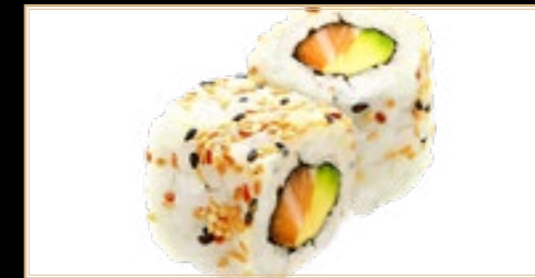
23 10.00€ Ocean Saumon Avocat