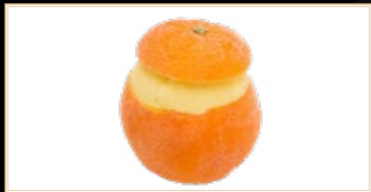
A7 6.00€ Orange Givrée Supplémentaire +3.00€