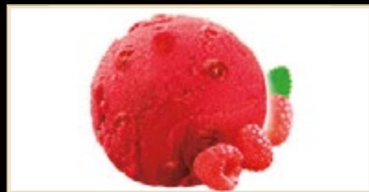
A11 5.00€ Sorbet framboise