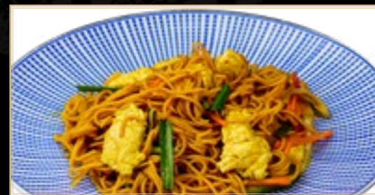
85 12.50€ Nouilles Sautées au Poulet