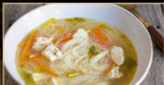
58 5.00€ Potage Poulet Au Vermicelles