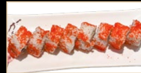
25 11.00€ California Crabe concombre oeufs de poisson