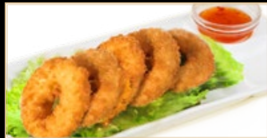
66 6.00€ Beignets De Calamars