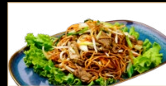
88 13.50€ Mi-fen au Bœuf