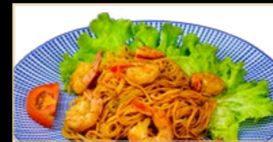
86 15.00€ Nouilles Sautées Aux Scampis