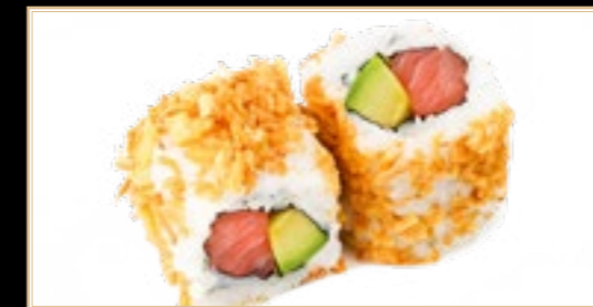
27 11.00€ Californai Oignon Frit Saumon avocat