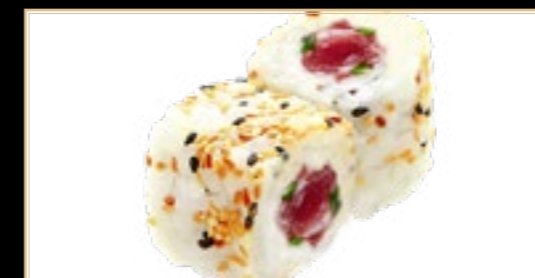
29 10.00€ Spicy tuna Thon Avocat Épicé