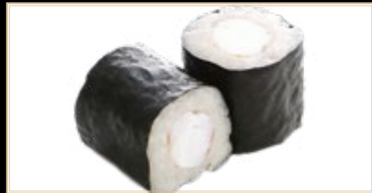
17 6.00€ Ebi Maki Crevette