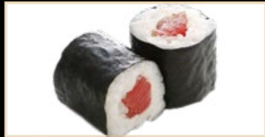
16 6.00€ Tekka Maki Thon