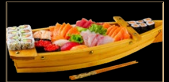
54 50.00€ Kyoto 14 Nigiri 14 Maki 12 sashimi