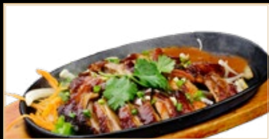
117 17.00€ Ti-pan Canard Piquante