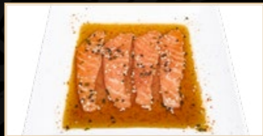
50 10.00€ Carpaccio Saumon