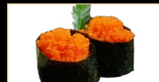
10 Tobiko Oeufs De Poisson 4.00€