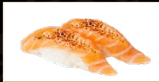
2 Saumon Spécial 5.00€