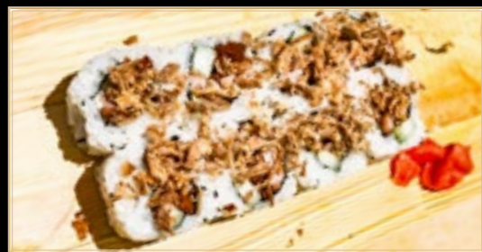
35 12.00€ Crevettes Et oignon frits