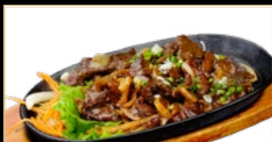
109 15.00€ Ti-pan Au Boeuf Piquant