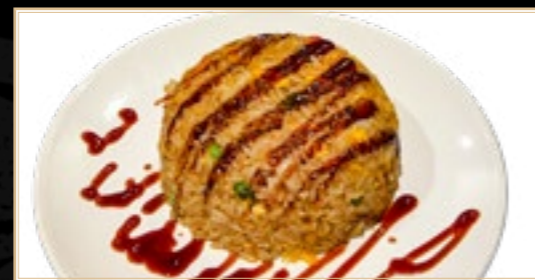
81 14.00€ Riz Yaki Meshi Chair de crabe, Calmar, Crevette