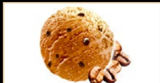
A16 4.50€ Glace Mokka