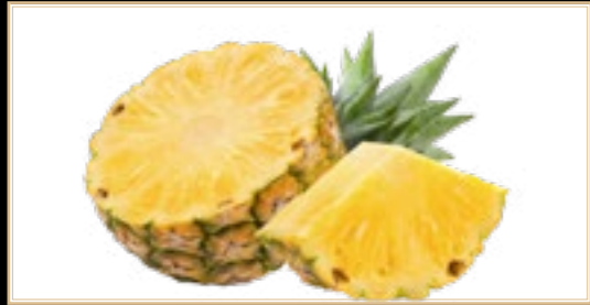
A1 5.00€ Ananas Frais Supplémentaire +2.00€