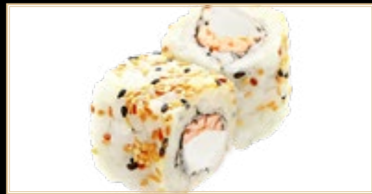
31 10.00€ Cooked Saumon Cuit Et Fromage