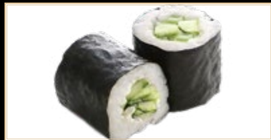
19 6.00€ Kappa Maki Concombre