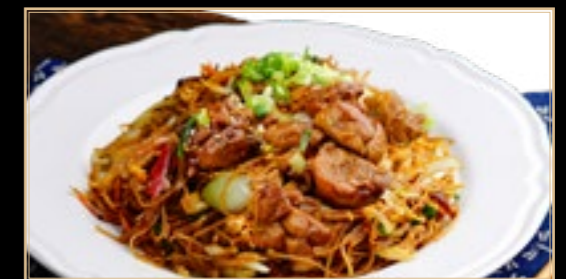
89 13.50€ Mi-fen au Poulet