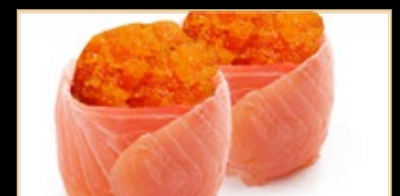
13 Sushi Jio Saumon Et Oeufs de poisson 6.00€