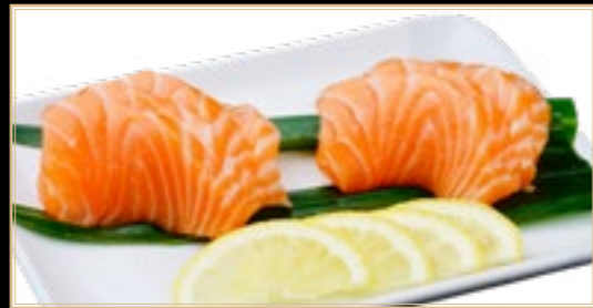
46 10.00€ Saumon