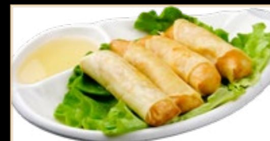
60 5.00€ Mini Croquettes végétarien