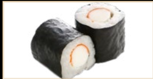
18 6.00€ Kani Maki Crabe