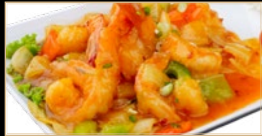
93 16.00€ Scampis À La Sauce Piquante