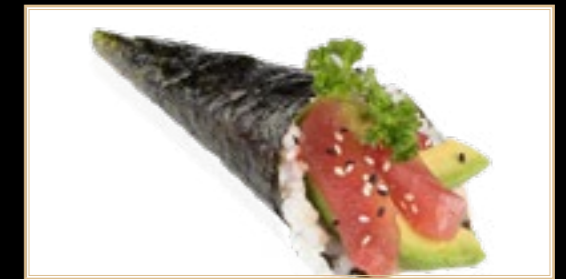
40 5.00€ Maguro Thon Avocat