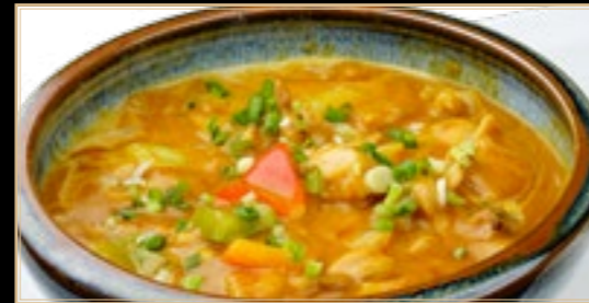
106 13.00€ Poulet à la Sauce Curry