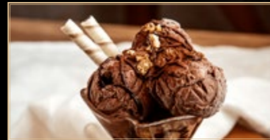
A9 5.00€ Dame Noir