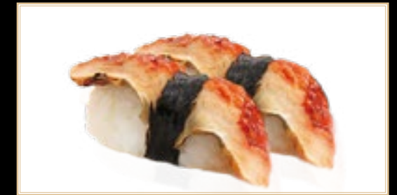
9 Unaghi Anguille 5.00€