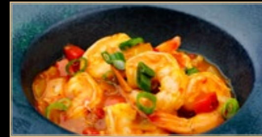
97 16.00€ Scampis À La Sauce Curry