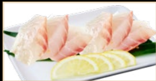
48 10.00€ Seabass Bar