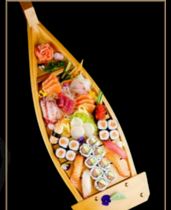
55 70.00€ Tokyo 20 Nigiri 20 Maki 18 sashimi