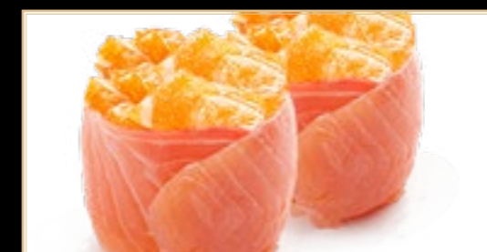
14 Sushi Sake Saumon 6.00€