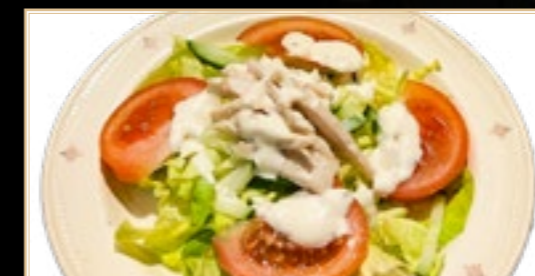
77 5.00€ Salade Au Poulet