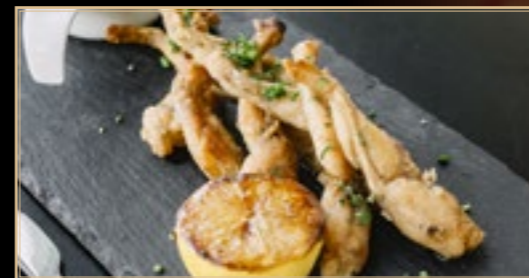
121 16.00€ Cuisses de Grenouilles au Beurre à l'Ail