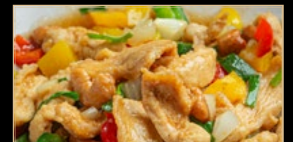
116 16.00€ Canard aux Ananas