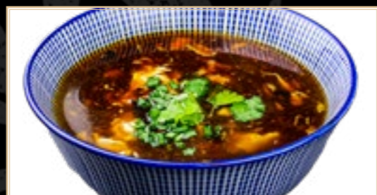
56 5.00€ Potage Oriental De Pekin (Oriental Piment)