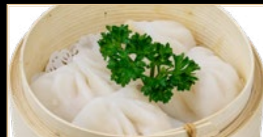
71 5.00€ Raviolis Chinois