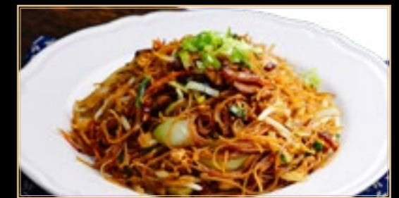
91 11.00€ Mi-fen aux Légumes