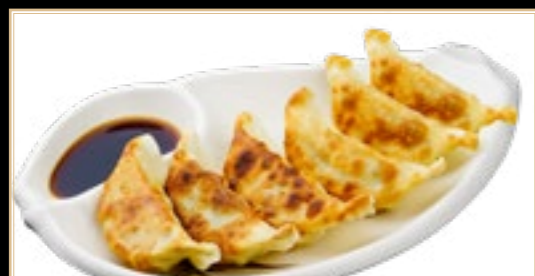
72 5.00€ Raviolis Pekinois Grillés