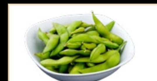
63 6.00€ Haricots De Soja