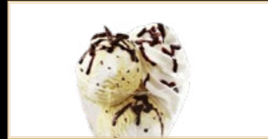
A8 5.00€ Dame Blanche