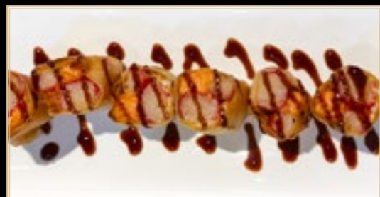
22 9.00€ Maki Spécial saumon et crabe