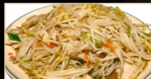
123 12.00€ Chop-suey au Poulet