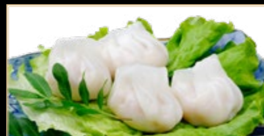
73 6.00€ Raviolis Aux Crevettes