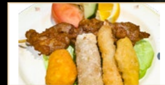
75 8.00€ Hors d'œuvre