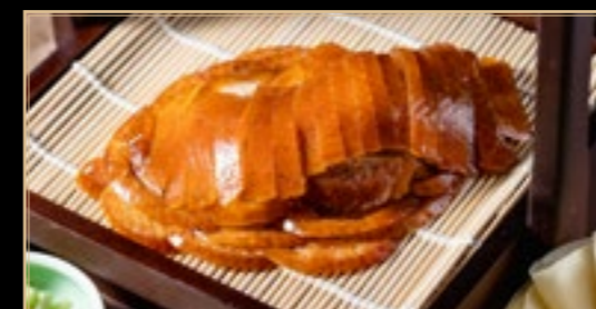
115 18.00€ Canard Laqué de Pékin Produit avec lactose