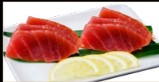
47 11.00€ Thon