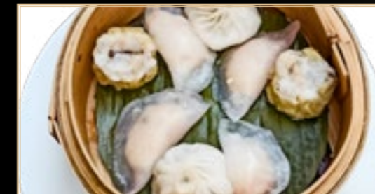
74 8.00€ Dim Sum Variés (6 pièces)