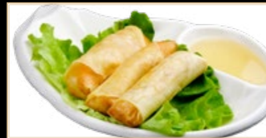
67 8.00€ Nêms aux crevettes