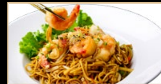
90 15.00€ Mi-fen Aux Fruits De Mer