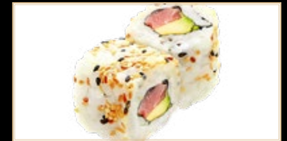
24 10.00€ Tuna Roll Thon Avocat