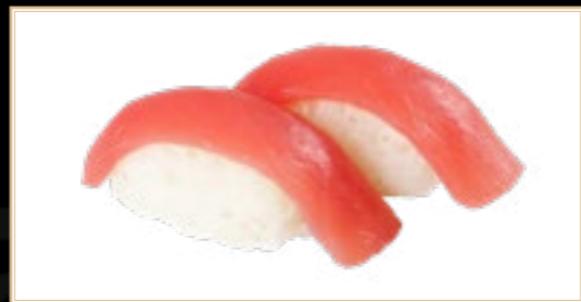
3 Maguro Thon 4.00€