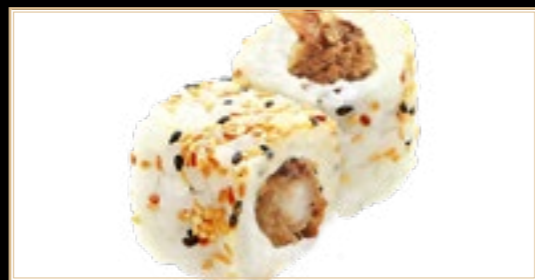
34 10.00€ Uramaki Ebitem Crevette et avocat