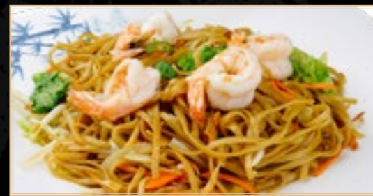
83 15.00€ Ti-pan Nouilles Fruits De Mer