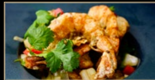
96 18.00€ Gambas Aux Cinq Parfums