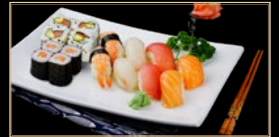
52 21.00€ Matsu Sushi 8 Nigiri 8 Maki