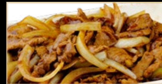
113 14.00€ Boeuf aux Oignons