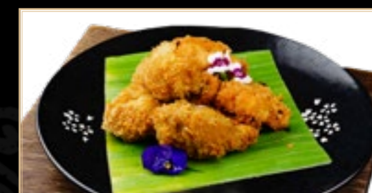
65 5.00€ Nuggets De Poulet