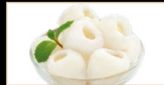
A21 4.00€ Fruits Litchi