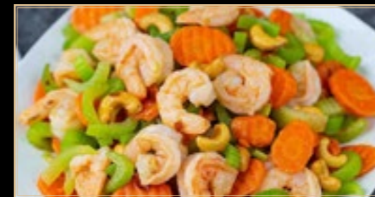
99 17.00€ Scampis Aux Noix De Cajou