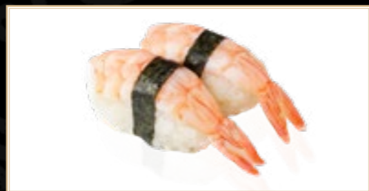
5 Ebi Crevette 4.00€