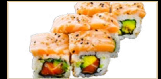
26 11.00€ Double Sake Saumon avocat