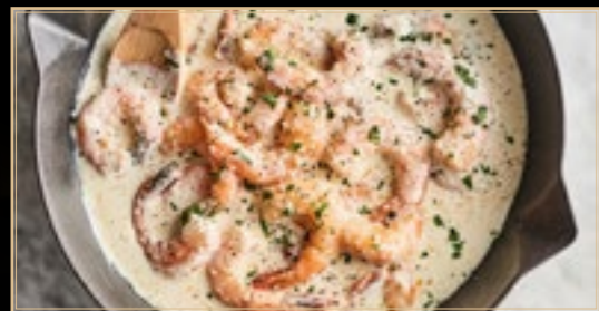
95 16.00€ Scampis Au Crème L'ail