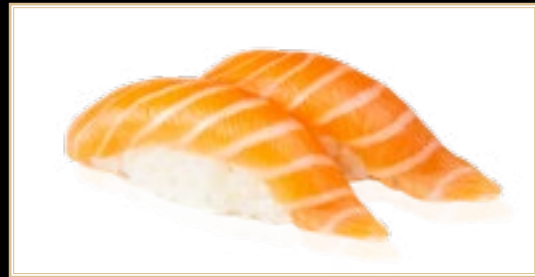
1 Sake Saumon 4.00€