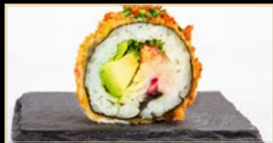
37 13.00€ Futomaki Frit Maki Frits