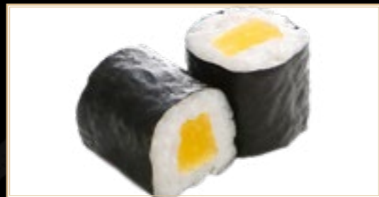
20 6.00€ Oshigo Maki Radis