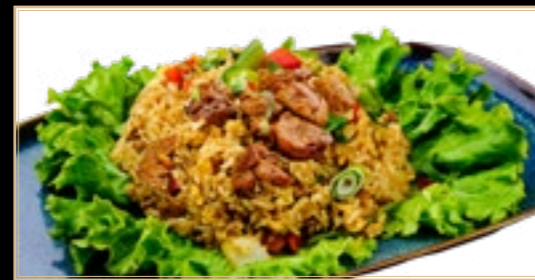
79 12.50€ Riz Sauté au Poulet