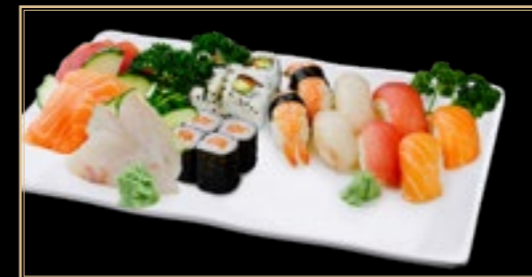
53 35.00€ Osaka 8 Nigiri 9 Maki 9 sashimi