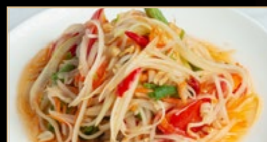
122 11.00€ Légumes Soja Sautés