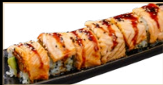
36 12.00€ Tiger Roll Crevette Saumon