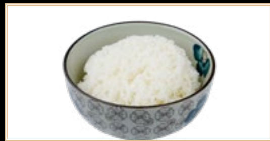
78 5.00€ Riz Blanc