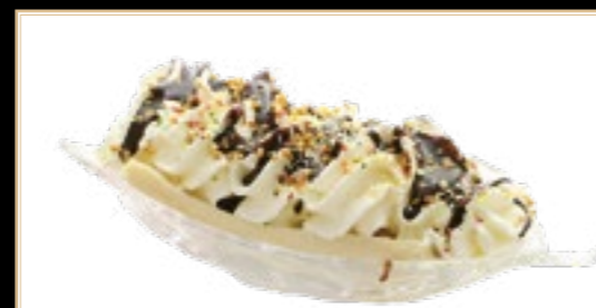
A20 5.00€ Banana-split