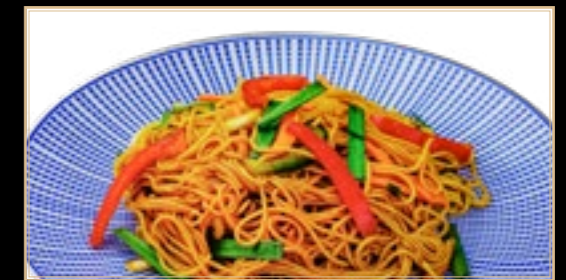
87 11.00€ Nouilles Sautées aux Légumes