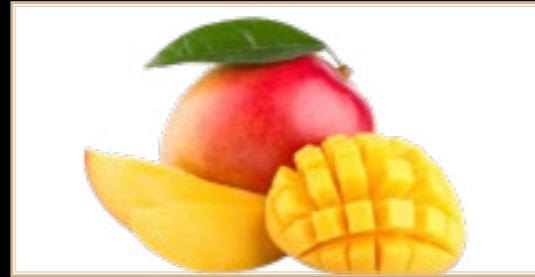
A2 5.00€ Mangue Frais Supplémentaire +2.00€