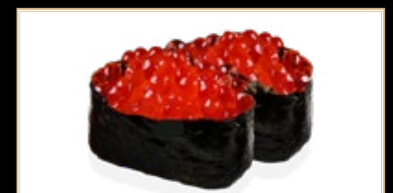
11 Ikura Oeufs De Saumon 6.00€