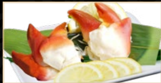
49 12.00€ Palourde Hokkigai