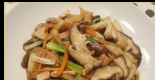
108 13.00€ Émincé de Poulet aux Champignons Chinois