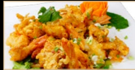
94 17.00€ Scampis Aux Cinq Parfums